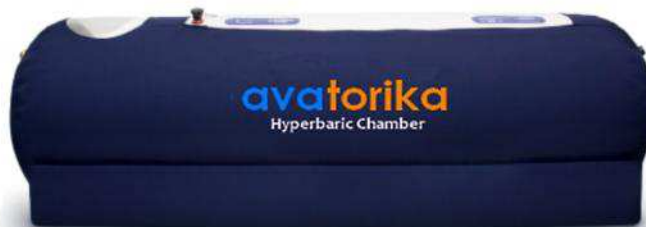
O2 Series, в исполнении O2-90