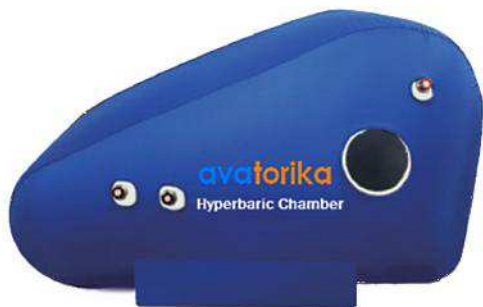
O2 Series, в исполнении O2-70