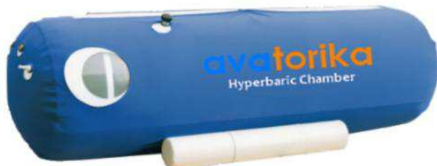
O2 Series, в исполнении O2-73